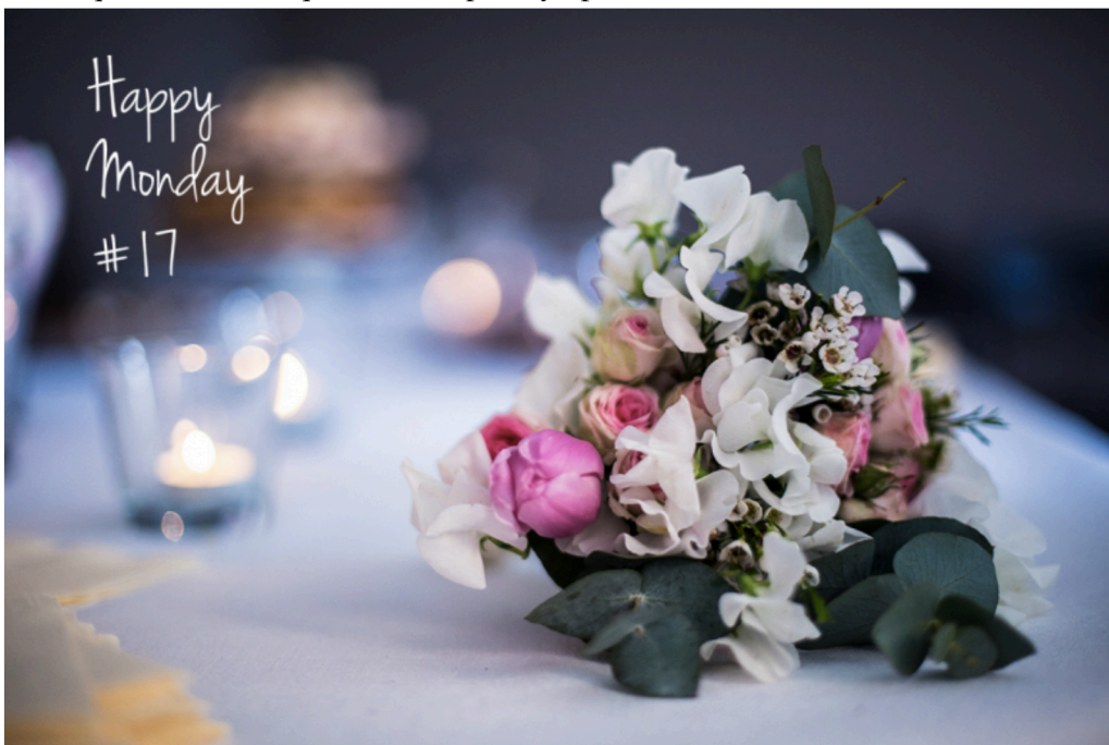
Ceci est mon 1er bouquet de mariée, réalisé pour une amie de longue date, qui le voulait tout petit et délicat.

C'est l'heure du HAPPY MONDAY! On voudrait tou(te)s que le we dure 3 jours surtout quand on a bossé tout le samedi et qu'on a eu que quelques heures le dimanche (par là je veux dire faire le ménage, les lessives et ranger pour recommencer la semaine en ordre...), mais non le lundi, c'est reparti et tant qu'à faire, c'est quand même plus sympa avec le sourire!